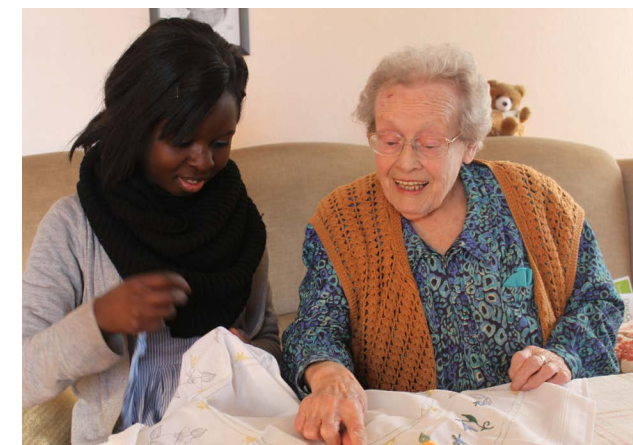
« Jeunesse et vieillesse, internationales » - Claus Martens

Les photos montrent des personnes âgées dans des situations très différentes et véhiculent une nouvelle image de la vieillesse et du vieillissement. Des photos de personnes actives et engagées côtoient celles montrant la vie de personnes âgées dépendantes. Les aspects les plus variés de la vieillesse et du vieillissement y trouvent ainsi leur expression.