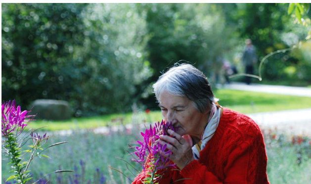
1ère place (amateurs) – « Se souvient-elle encore ? », Fritz Friesl